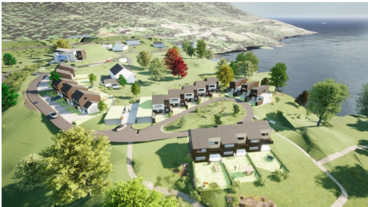
Figur 22. 3D-illustrasjon av ny bebyggelse sett frå nordaust.

plantning, felles drivhus med vidare. Areala skal vere utforma etter prinsipp om universell utforming. Det største området (UTE1) danner sentrum i det inste tunområdet, og vil kunna bli ein viktig møttestad når feltet er bygd ut. Nedunder er det vist ein illustrasjon sett frå nordaust.