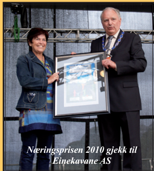
Næringsprisen 2010 gjekk til Einkevane AS