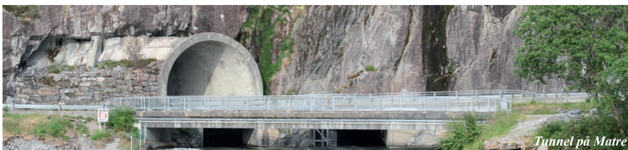
Tunnel på Matre

Søkjarar som har motteke lån til prosjekt skal sende inn årsmelding til styret for kraftfondet årleg inntil lånet er nedbetalt/innfridd innfridd og søkjarar som har vorte tildelt tilskot gjennom kraftfondet skal sende inn rekneskap/årsmelding for det aktuelle år tilskotet vart utbetalt med tilbakemelding om kva betydning tilskotet hadde for det aktuelle året”.