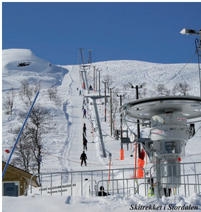
Skitrekke i Stordalen

Ein har elles mellombelse utlån gjennom kraftfondet som;